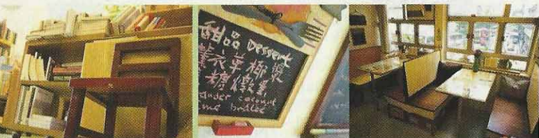
書店中文名「藝鵝」音譯自英文店名簡寫aco。「鵝」(音:谷)指天鵝，亦有期望之意。書店最近闢出一角做「慢食館」。客人吃的蔬菜、香草採自富德樓的天台農場，坐的卡位則來自中環已結業的茶餐廳。