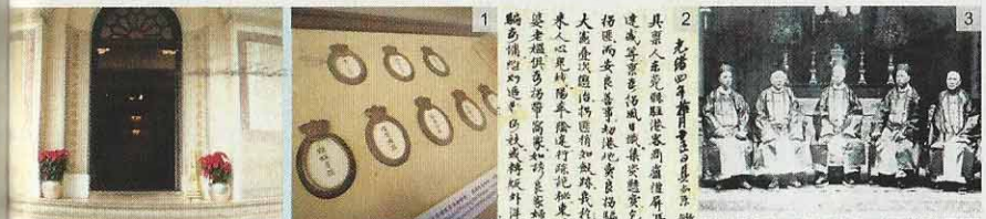
他們的總理身份雙明牌 1 ，在宵禁期間可作通行證使用。館內藏有1878年由東莞縣儒商盧廣揚、馮晉熙等上書港督請准設立保良局的手抄本 2 ，也有早年的總理合照 3 。

博物館內保存了局方為入局婦孺所記下的口供紀錄，每一頁都是一個故事。當中有被拐賣的兒童，有因婆媳不和離家出走的，有被迫良為娼的，也有被主人虐待的妹子；保良局都為他們一一尋找出路，有的等待親人領回、有的送返原籍、有的尋找工作，甚至安排領婚等，「我們會安排男女雙方見面，大家情投意合的話，便由總理在關帝廳主持證婚。」最後一次領婚是在1971年，其時局方已設中學，女孩子多選擇求學，不需再由保良局作媒了。當年的保良局總理享有實權，可聘請暗差替局方追查拐帶案件。