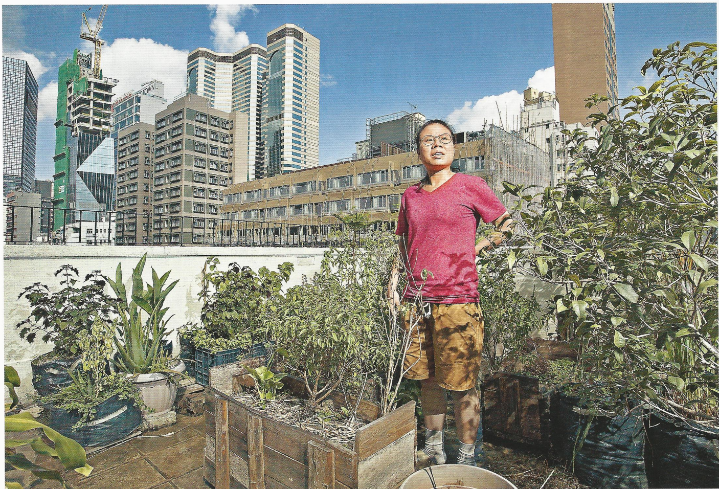
這個不向公眾開放的天台有「自家種植」的薄荷、香茅等香草，自給自足，供芝鵠「Food Art」之用。