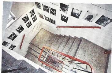
樓梯一圈圈，重點是牆壁上的東西。

艺鶴支持本地藝文創作者，希望能透過協辦展覽或講座等活動，讓一些藝術、文化的意念創作得到萌芽和成長。