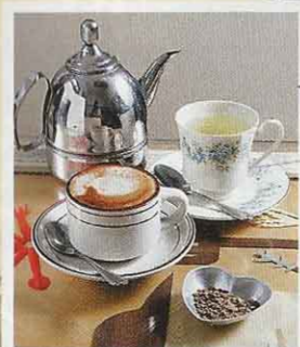
只須付20元，場內靚咖啡花茶任飲。

每位客人只須付20元，便可坐足全日，場內飲品如公平交易咖啡，以及店主親自種植的香草茶更是任斟任飲。