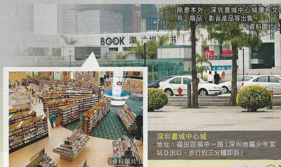
除書本外，深圳書城中心城還有文具、精品、影音產品等出售。(資料圖片)

不少人專門前來買平價字典。至於一般讀物，不少售價低至10元人民幣一本，減價期間，不難找到幾蚊一本的好書。