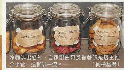
除咖啡出名外，自家製曲奇及番薯條是店主推介小食，送咖啡一流。